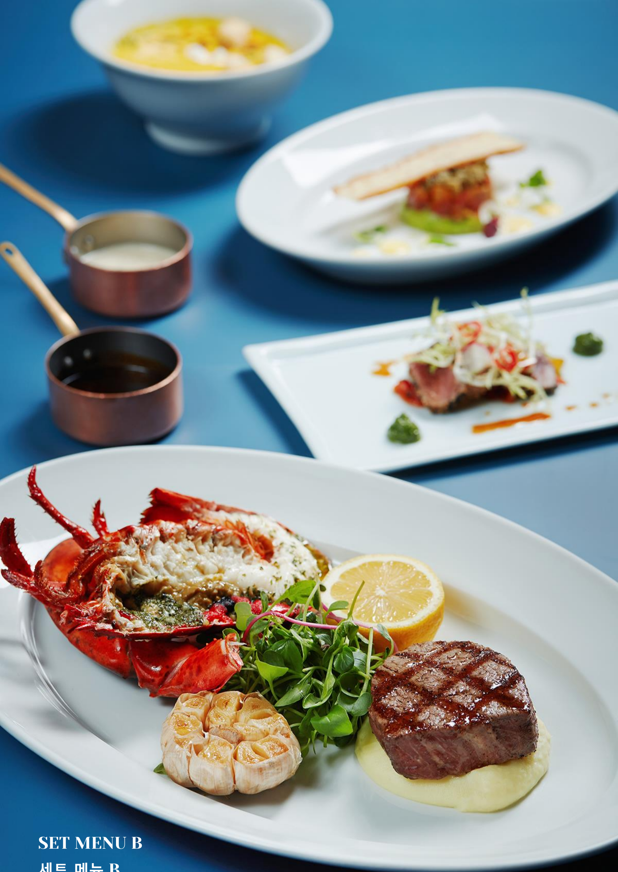
SET MENU B 세트 메뉴 B