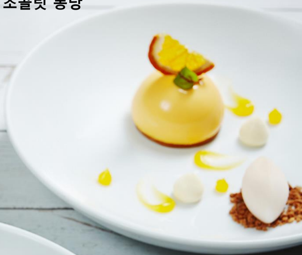
JEJU HALLABONG MOUSSE 제주 한라봉 무스