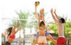
A PARTIR DAS 9H ATIVIDADES NA PRAIA STARTING AT 9 AM ACTIVITIES ON THE BEACH