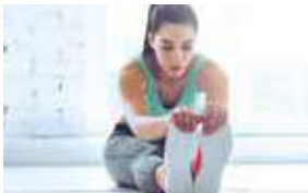
9H 9 AM ALONGAMENTO STRETCHING FITNESS CENTER STUDIO