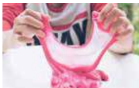
OFICINA DE SLIME SLIME GAME

ATIVIDADES ESPECIAIS NO CAMP HYATT ACTIVITIES IN CAMP HYATT