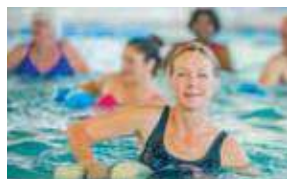
11H 11 AM HIDROGINÁSTICA NO SUNDECK WATER AEROBICS