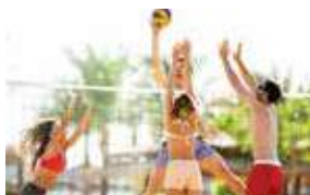
A PARTIR DAS 9H ATIVIDADES NA PRAIA STARTING AT 9 AM ACTIVITIES ON THE BEACH