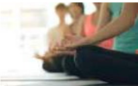
7H30 7:30 AM HATHA YOGA FITNESS CENTER STUDIO