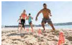
8H 8 AM CIRCUITO FUNCIONAL NA PRAIA CIRCUIT TRAINING ON THE BEACH