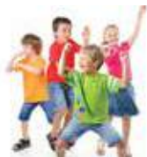
ATIVIDADES COM MÚSICA MUSICAL ACTIVITIES