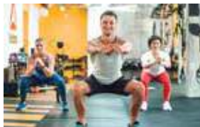
9H 9 AM CIRCUITO FUNCIONAL CIRCUIT TRAINING FITNESS CENTER STUDIO