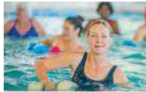
11H 11 AM HIROGINÁSTICA NO SUNDECK WATER AEROBICS