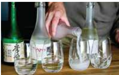
16H - SAKÉ EXPERIENCE SHISO 4 PM - SAKE EXPERIENCE SHISO

Descubra as origens e os segredos da bebida mais tradicional do Japão. Participe do delicioso workshop de saké, com direito à degustação.