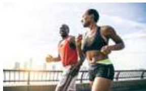
6H20 6:20 AM GRUPO DE CORRIDA MEETING POINT: CONCIERGE HYATT GROUP RUN