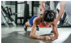
11H 11 AM CORE TRAINING FITNESS CENTER STUDIO