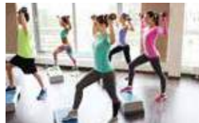
13H30 1:30 PM PUMP FITNESS CENTER STUDIO