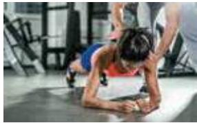
11H 11 AM CORE TRAINING FITNESS CENTER STUDIO