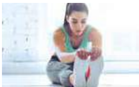
9H 9 AM ALONGAMENTO STRETCHING FITNESS CENTER STUDIO