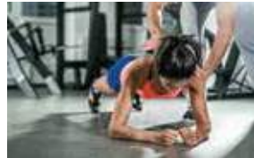
11H 11 AM CORE TRAINING FITNESS CENTER STUDIO