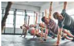
9H 9 AM CIRCUITO FUNCIONAL CIRCUIT TRAINING FITNESS CENTER STUDIO