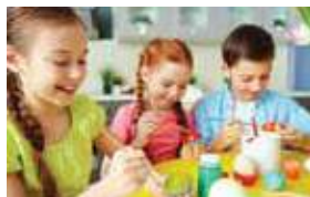
OFICINA DE ARTE ART CLASS GINCANA E JOGOS GAMES