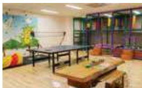
A PARTIR DAS 10H STARTING AT 10 AM