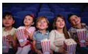
18H 6 PM CINEMINHA COM PIPOCA MOVIES AND POPCORN FOR KIDS MARAPENDI LOUNGE (SUBSOLO / -1 FLOOR)