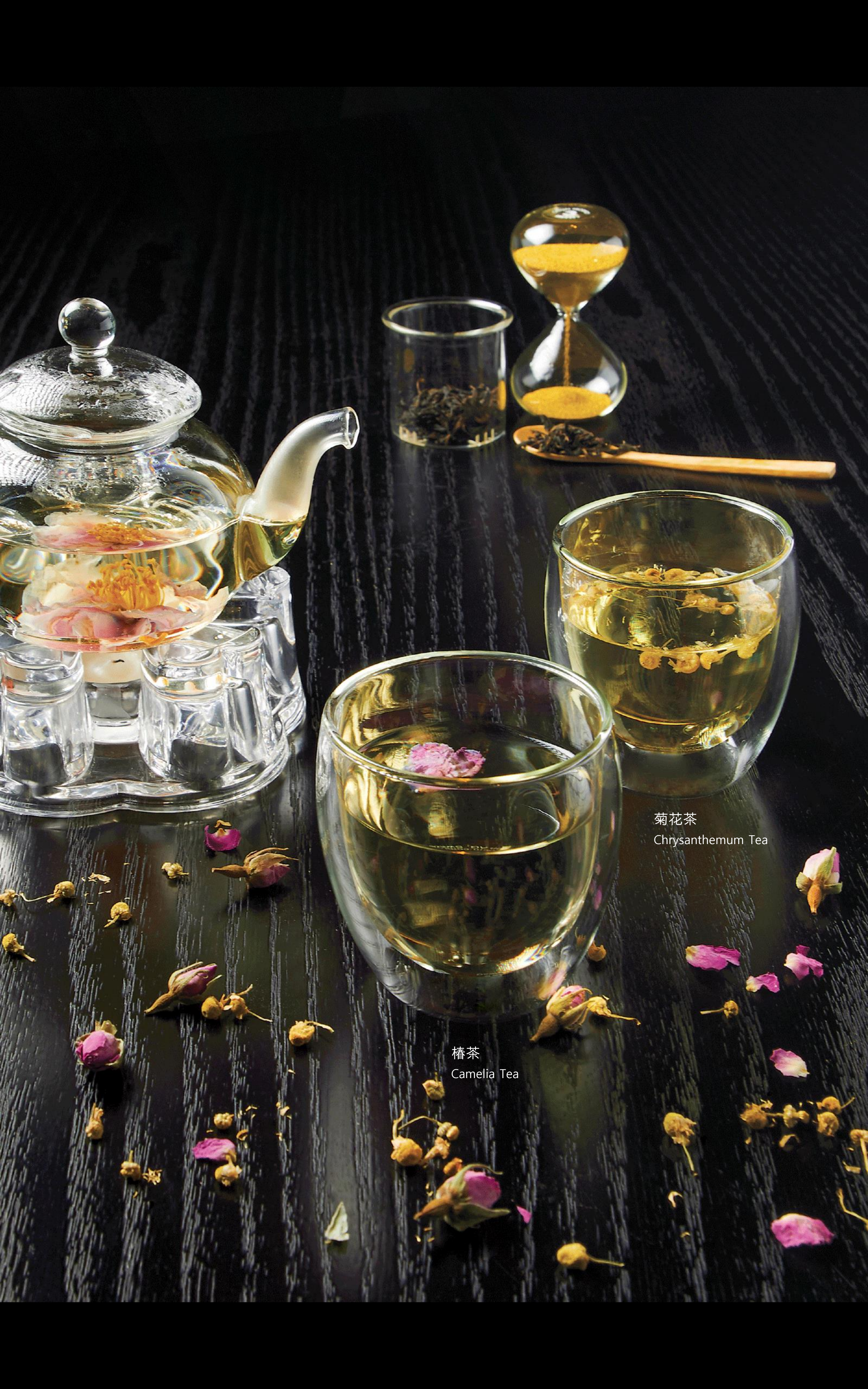
菊花茶 Chrysanthemum Tea