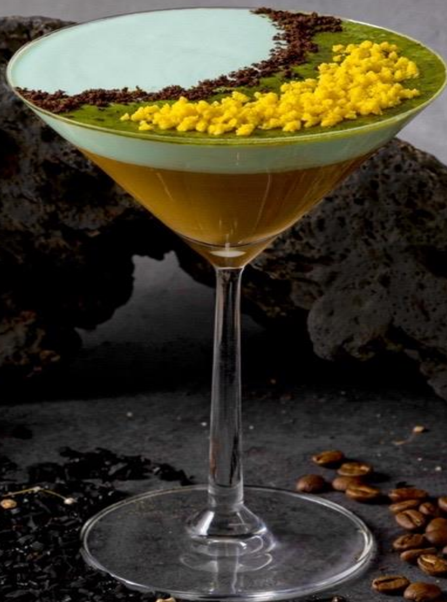
Dream Latte 梦幻拿铁