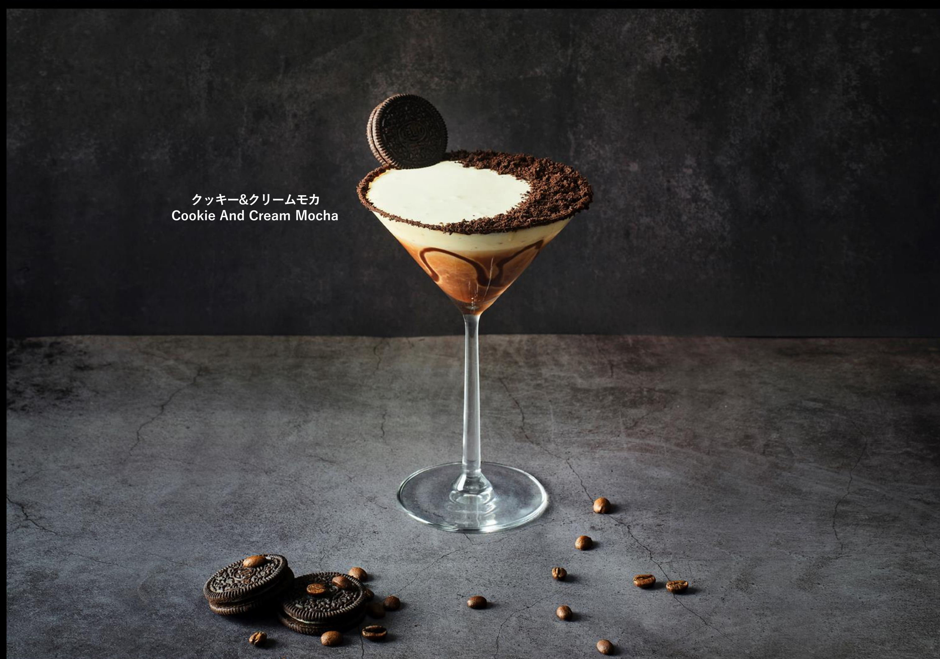
クッキー&クリームモカ Cookie And Cream Mocha