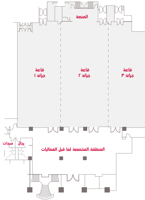
قاعة جراند- مستوى اللوبي