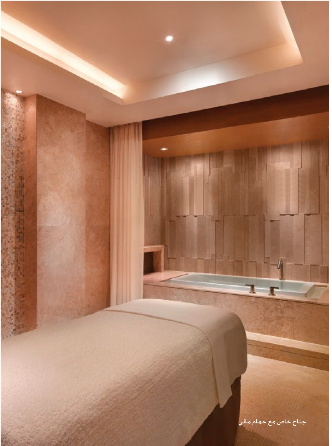
جناح خاص مع حمام مائي