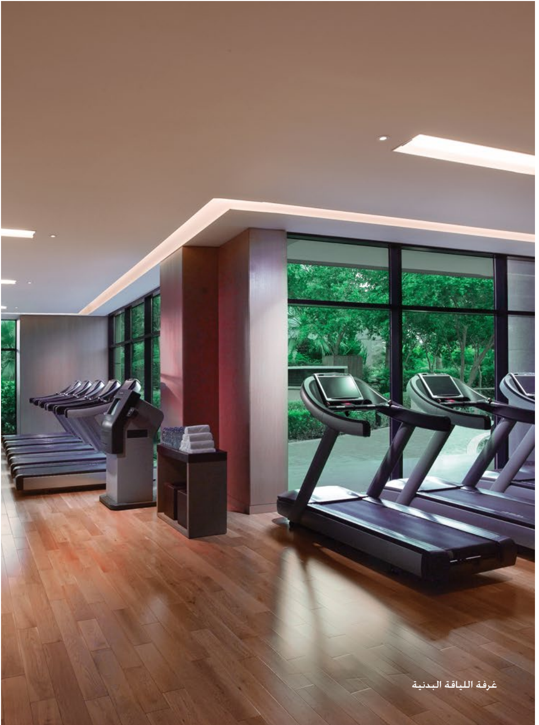
غرفة اللياقة البدنية