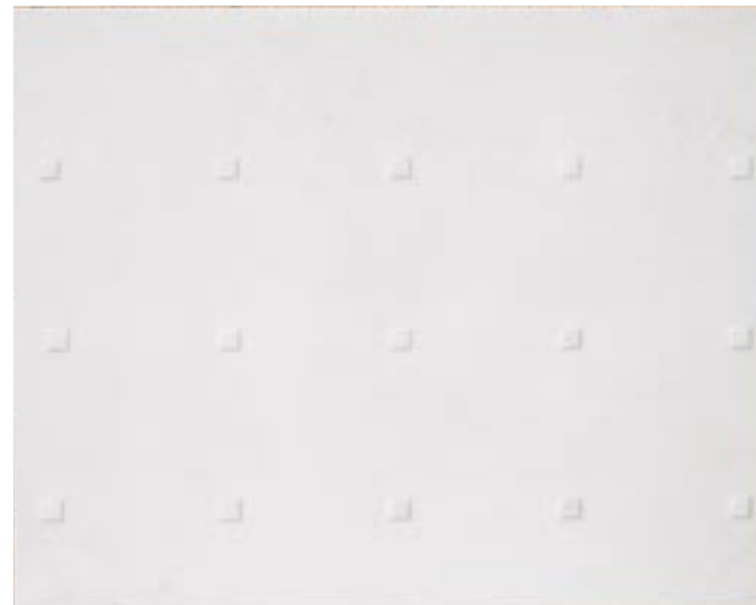
«Ohne Titel» 2004, Carrara marble, 80 x 100 x 2.5 cm each

The artist pair Frehner/Henking adopt conceptual strategies to stage archaic, sensual, material realities. Two transverse rectangular slabs of Carrara marble are regularly structured with square bosses so that their positive and negative forms constitute a single virtual unit like Yin and Yang. The geometric order system is reminiscent of a static elementary natural grid, the play of light on the delicate, skin-like irregularities of the marble releases an immaterial surge that can change at any moment like the clouds in the sky. These "Tablets of the Law" emphatically portray both timeless validity and permanent transformation.