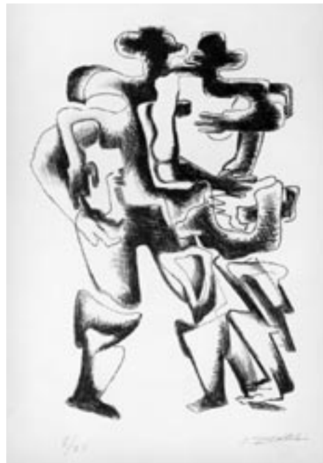
Deux Personages, 1961, Lithography, 76 x 56 cm

The Russian-French sculptor Ossip Zadkine absorbed decisive impulses from Rodin and Picasso in Paris in 1909. From then on he dedicated his creation to the synthesis of Rodin's pathos and Picasso's cubistic analysis of the human figure. Zadkine visualises figures by drawing flowing, expressive gestures that redefine the dividing lines between the individual and his surroundings. His figures not only coalesce with one another they also enter into new bonds with nature as in Ovid's Metamorphoses. Where Utopia is not possible, dramatic gestures express the longing for harmony and universal union. Zadkine also expressed these themes as a draughtsman. The lithograph “Deux Personages” visualises his striving to incorporate the duality of individual beings in one common body.