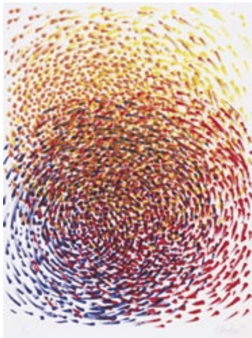
«Interferenzen 2001», 4-colour lithography, 80 x 60 cm, e/a

German artist Günther Uecker is one of the greatest sceptics in post-war art. On principle he starts at zero to be sure that he does not take over anything false. The principal protagonist of the Zero Group elected the nail, which till then had played an invisible subservient role, to the universal vehicle of expression for his art. The circle, spiral and square cannot be reinvented, but Uecker “nailed them down” so pregnantly that it seems as if something long forgotten has reappeared. Uecker also reconstructs primeval states in his role as graphic artist, when he virtually hacks the first possible woodcut out of a trunk with a stone axe. Or when he arranges thick black strokes of charcoal around a fulcrum in an archetypal spiral.