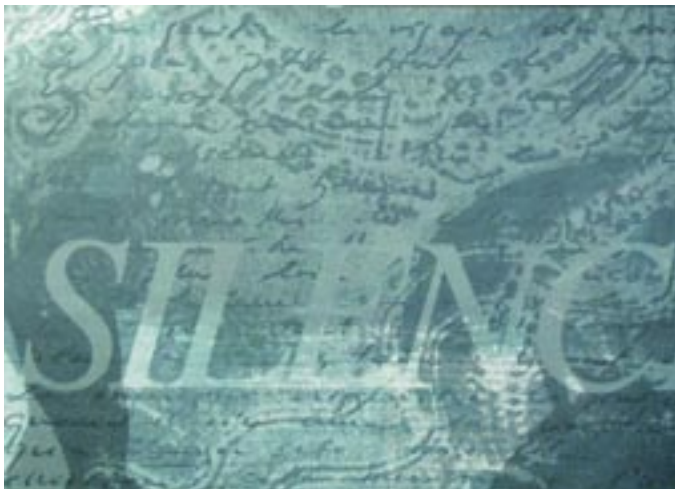
Silence, 2003, photo collage, 84 x 120 cm