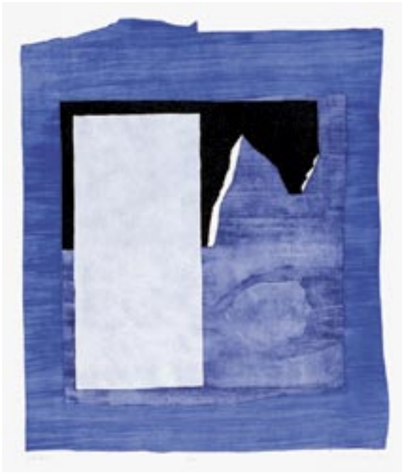
Vento dell'Est , 1979, Lithography, 63 x 50 cm

Caricature is the ability to leave out the non-essential. A genial talent for drawing does not make a caricaturist; it is merely the vehicle of expression. A caricaturist is primarily a juggler of ideas who pans the nuggets out of the infinite facets of every day life. The caricature teaches us to see a familiar object or event differently, in a new light. It should strike a chord when we look at it. It is the drawing and execution alone that decides whether the play of ideas remains merely a gag or lives on as art. Ted Scappa, like Paul Flora and Tomi Ungerer, is a first-class draughtsman. His verbal and pictorial wit is lapidary and indestructible. The momentary interests him primarily when the all-too-human aspect of the 'condition humaine' emerges. In this way he shows what can happen if you do not peek into the cook's pots.