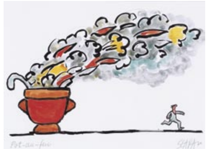
Pot-au-feu , 19xxxx, Gouache