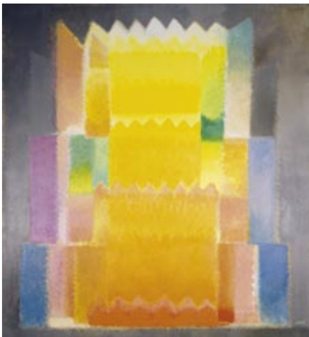
Lumière et Couleur, 2004, acryl on canvas, 317 x 292 cm

Kandinsky saw a possible successor in his colleague, 34 years younger and a compatriot who, like him, had emigrated to Paris. Confronted with Poliakoff's first abstract painting in 1938, Kandinsky announced: "Pour l'avenir, je mis sur Poliakoff". As in Delaunay and Otto Freundlich, Poliakoff's abstraction is based on the intuitive coalescing of irregular monochrome colour surfaces that continually create weightless new naturalistic states of harmony. Poliakoff claimed that the objective of his art was to lend his forms both external and internal depths of colour. And he managed to do this thanks to his careful but energy-packed stroke that makes colour vibrate and allows every composition to generate new "tones". The lucid surfaces render spiritual depths of space perceptible on a par with Rothko somewhat later.