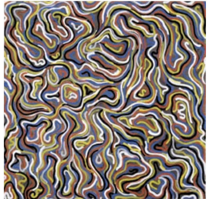
Brushstrokes, 1996, gouache on paper, 153.7 x 153.7 cm

"The concept is the art" formula characterises Sol LeWitt's masterly final flourish on the development of modern classicism. At heart, LeWitt is concerned with the systematic interplay of different variation options within a closed system "pertinent to nothing other than itself", whether as a consequence of modular grid images, as the architecture of murals neutralising all else, or as photographic research. Sol LeWitt, one of the principal protagonists of minimal art, experimented not only with geometric variations but also with others that produce irrational effects. His large-format serpentine patterns are a further development of geometric meanders, decisive proof that creativity still permits innovation even in the era of post-modern randomisation.