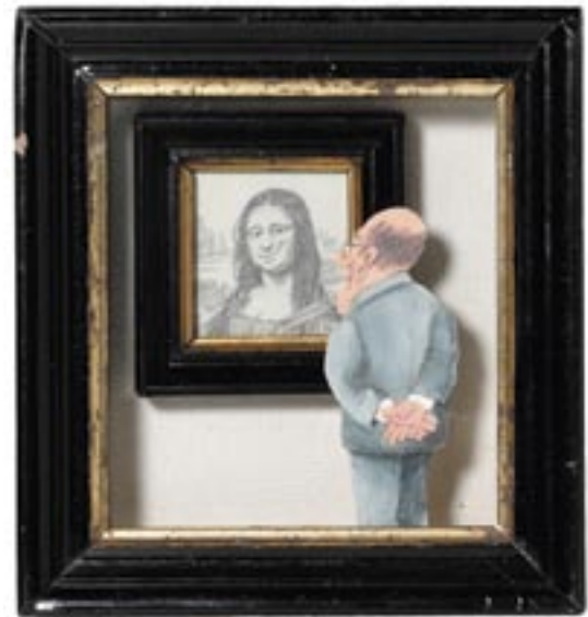
JÜSP (Jürg Spahr), La Gioconda, 1978, Mixed Media 16,3 x 17,4 cm

A work of art, as a rule, rarely leaves us cold. Either we are moved and enthusiastic; or, if our expectations of beauty are not fulfilled, we are hurt and furious – feeling that no one can fail to know what art ought to be. Should art remain indifferent in the face of so much affection and antipathy? Pygmalion experienced the miracle of the beauty he had sculpted from a block of stone stepping down from the pedestal to fall into his arms. Our modern Pygmalion by JÜSP did not create the Mona Lisa himself, but she cannot resist changing her smile a little in the face of such a connoisseur. Hitting back is the common feature of the cartoon series. The cartoonists hand out fines for the contempt noble art has to suffer daily at the hands of the philistine public.