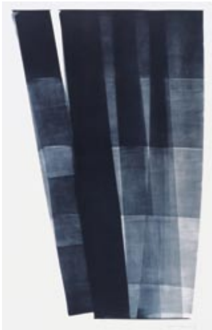
L-7-1973, Lithography, 105 x 75 cm

Hans Hartung, the German-born artist who fought for France against fascism in the Second World War, created a European pendant to Pollock's action painting with his contribution to the informal. Starting with the surrealist "écriture automatique" or automatic writing, his direct notation of psychomotoric energy expresses the existential questioning of being. In later years he experimented with new techniques: despite all its vehemence, paint applied with a spray gun led to a materialisation and calming of the abstract gesture. Aggressively channeled and divided mists of colour ranging from the transparent to the impervious lend his later work a highly charged polarity. Energy impulses flow and extend, only to be held back consistently by clear definition of form.