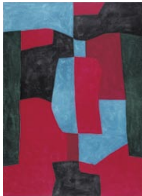
Composition abstraite, 1969, Lithography, 105 x 75 cm