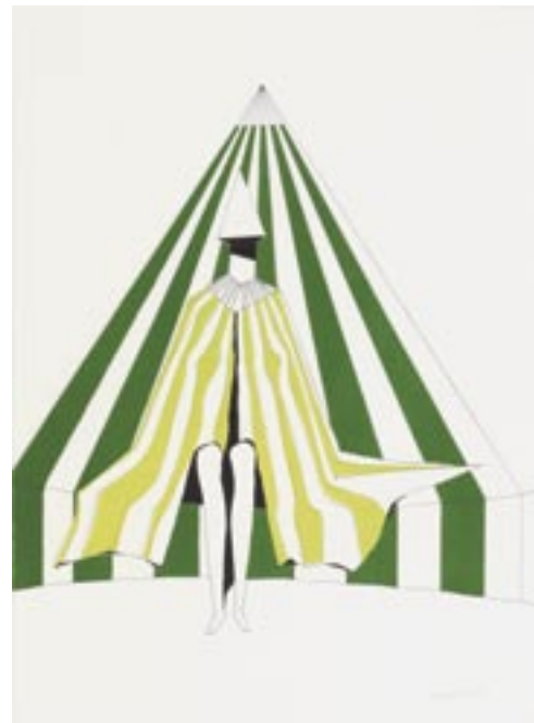
«Sitting lady», Lithography 1972, 90 x 63 cm