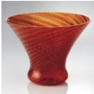
4 vessels from the Venini workshop. Design:.....