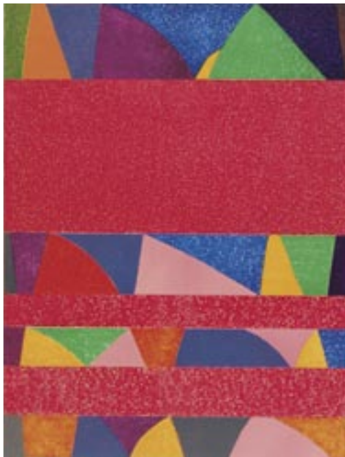
«Wassili», Lithography 1973, 95 x 67 cm

Dorazio discovered his own path of concrete form in the encounter with Max Bill's work at the Milan Triennale in 1951. What fascinated him, however, was not the pure geometry, but colour and light as optical phenomena. He became a concrete pointillist who, in the course of his development, came to specialise increasingly in the "concrete" resonance of naturalistic moods. He lets structural fields of dots, lines or bands change the aggregate status. Systematic structures start to oscillate, chaos looms. The eternal validity of concrete order is called into question in Dorazio's work because he starts not from the ideal, but from the permanent mutability to which form is exposed over space and time. The writer Alfred Andersch described Dorazio's art as "a natural reality of the spiritual".